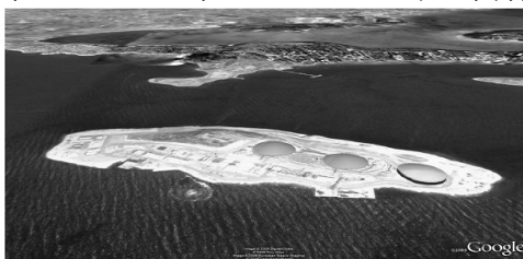
Εικόνα 1: Εναέρια προσεγγιστική όψη τερματικού σταθμού νήσου Ρεβυθούσας με την εγκατάσταση της 3 ης δεξαμενής.

Ο ΔΕΣΦΑ έχει αιτηθεί τη συγχρηματοδότηση του έργου από το ΕΣΠΑ προκειμένου να ελαχιστοποιηθεί η επιβάρυνση των τιμολογίων χρήσης του ΕΣΦΑ από την επένδυση αυτή. Εγκρίθηκε ποσοστό επιχορήγησης (δημόσια δαπάνη) 35% του επιλέξιμου κόστους μέσω του Προγράμματος Δημοσίων Επενδύσεων (ΠΔΕ) στο πλαίσιο του ΕΣΠΑ. Το υπόλοιπο ποσό (65%) του συνολικού προϋπολογισμού που δεν θα συγχρηματοδοτηθεί από το ΠΔΕ θα καλυφθεί από ίδια κεφάλαια και δανεισμό. Όσον αφορά στο δανεισμό, ο ΔΕΣΦΑ αιτήθηκε τη χορήγηση δανείου ύψους 80 εκ. € από την ΕΤΕπ το οποίο εγκρίθηκε από το Διοικητικό Συμβούλιο της τελευταίας. Ήδη έχει εκταμειωθεί η πρώτη δόση των 40 εκατ. €. Το κόστος της επένδυσης που δεν θα επιδοτηθεί από το ΠΔΕ δεν έχει ενταχθεί στη Ρυθμιζόμενη Περιουσιακή Βάση του ΕΣΦΑ που χρησιμοποιήθηκε για τον υπολογισμό των χρεώσεων χρήσης ΕΣΦΑ που ισχύουν βάσει της υπ' αριθμ. 722/2012 Απόφασης της ΡΑΕ. Σύμφωνα με τον Κανονισμό Τιμολόγησης (άρθρο 20 παρ. 1.α.iii) η εν λόγω επένδυση εντάσσεται στη ΡΠΒ κατά το έτος έναρξης της λειτουργίας του έργου.